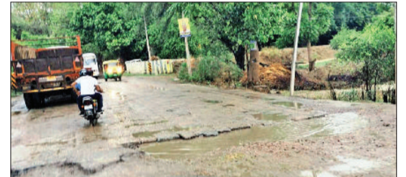
कनीना। उन्हाणी के समीप लीकेज साइफन से खंडित सड़क।

मिशन बुनियाद कार्यक्रम के तहत विद्यालय स्तरीय जागरूकता व पंजीकरण अभियान 13 नवंबर से प्रदेशभर में शुरू हो चुका है। इस अभियान का उद्देश्य कक्षा आठवीं के विद्यार्थियों को योजना की जानकारी देना और उन्हें समय पर पंजीकरण के लिए प्रेरित करना है। इसके बाद रजिस्ट्रेशन प्रक्रिया 16