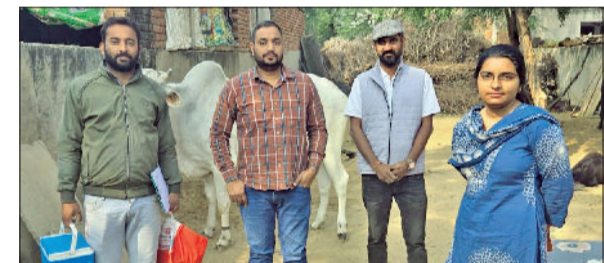
रेवाड़ी। गांव लिसान में वैक्सिनेशन करने पहुंची टीम।

पशुपालन एवं डेयरी विभाग की ओर से जिले में राष्ट्रीय पशुरोग नियंत्रण कार्यक्रम के तहत गाय, भैंस, भेड़, बकरी और सूकर प्रजाति के पशुओं में खुरपका, मुंहपका और गलघोट्टू जैसी बीमारियों से बचाव के लिए वैक्सिनेशन कैंपेन चलाया जा रहा है। भारत सरकार की ओर से