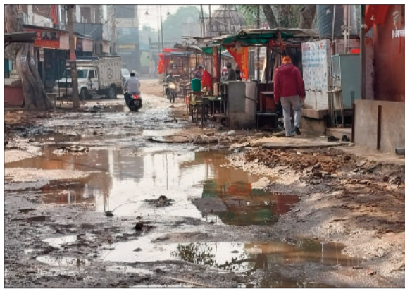
रेवाड़ी। बड़ा तालाब हनुमान मंदिर के सामने खोदी गई सड़क पर जमा सीवर का पानी तथा सड़क बनाने से सीवर लाइन के पाइप डालती जेसीबी।

शहर के आस्था के केंद्र बड़ा तालाब स्थित प्राचीन हनुमान मंदिर की सड़क की लंबे समय के बाद दशा सुधारने का कार्य शुरू हो चुका है। हनुमान मंदिर में आने वाले श्रद्धालु और आसपास के लोग पिछले एक दशक से सड़क पर सीवर ओवरफ्लो व बरसात से जलभराव की समस्या से परेशान थे। अब हनुमान मंदिर में आने वाले श्रद्धालुओं व स्थानीय निवासियों की समस्या से निजात मिलने वाली है। नगर परिषद की ओर से हनुमान मंदिर के सामने की सड़क पर पहले 12 इंची ड्रेनेज पाइपलाइन डाली जा रही है। पाइपलाइन का कार्य पूरा होने के बाद सीसी रोड निर्माण किया जाएगा। करीब 850 मीटर लंबी सड़क के निर्माण व 12 इंची ड्रेनेज पाइपलाइन डालने में नगर