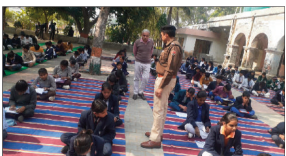
रेवाड़ी। सड़क सुरक्षा प्रश्नोत्तरी परीक्षा देते विद्यार्थी तथा सड़क सुरक्षा प्रश्नोत्तरी परीक्षा देते विद्यार्थी।