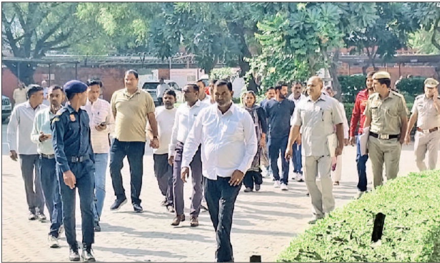
24 अक्टूबर को बैठक स्थगित होने पर सचिवालय से बाहर आते ब्लॉक समिति सदस्य फाइल फोटो।