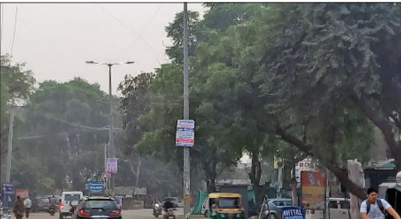
रेवाड़ी। शहर में वीरवार शाम को छाया सांभल।

समय लोगों को सर्दी से राहत मिली रही। अधिकतम तापमान 1.0 डिग्री सेल्सियस बढ़कर 29.0 डिग्री पर पहुंच गया। न्यूनतम तापमान 0.5 डिग्री की वृद्धि के साथ 8.5 डिग्री सेल्सियस दर्ज किया गया। दोपहर बाद तक मौसम का मिजाज गर्म बना रहा। हवा की रफ्तार काफी कम 5 किमी प्रति घंटा रही, जबकि हवा में नमी का स्तर 61 प्रतिशत रहा। दिन का तापमान सामान्य से 3.5 डिग्री ज्यादा हो गया है, जबकि रात का तापमान 1.0 डिग्री कम चल रहा है। तापमान में वृद्धि बीते बुधवार को आसमान में बादल छाने के बाद हुई है। मौसम विभाग