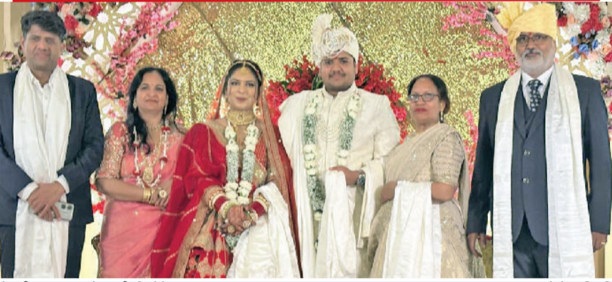
रेवाड़ी। वर-वधू को आशीर्वाद देते हुए।